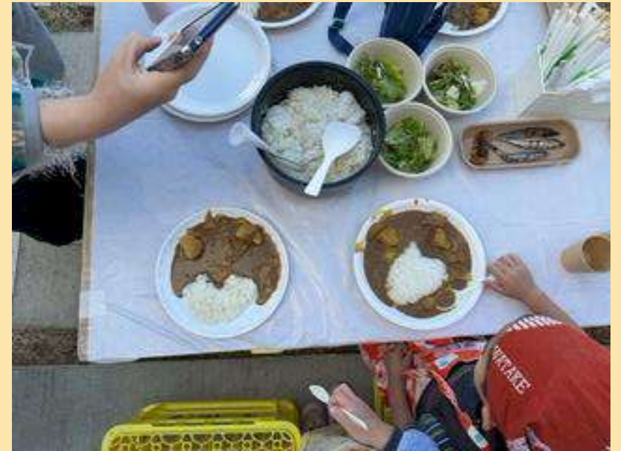
ハート型のライス