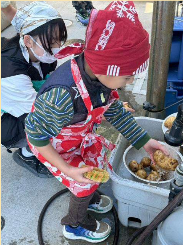
冷たい水で野菜を洗う4歳児