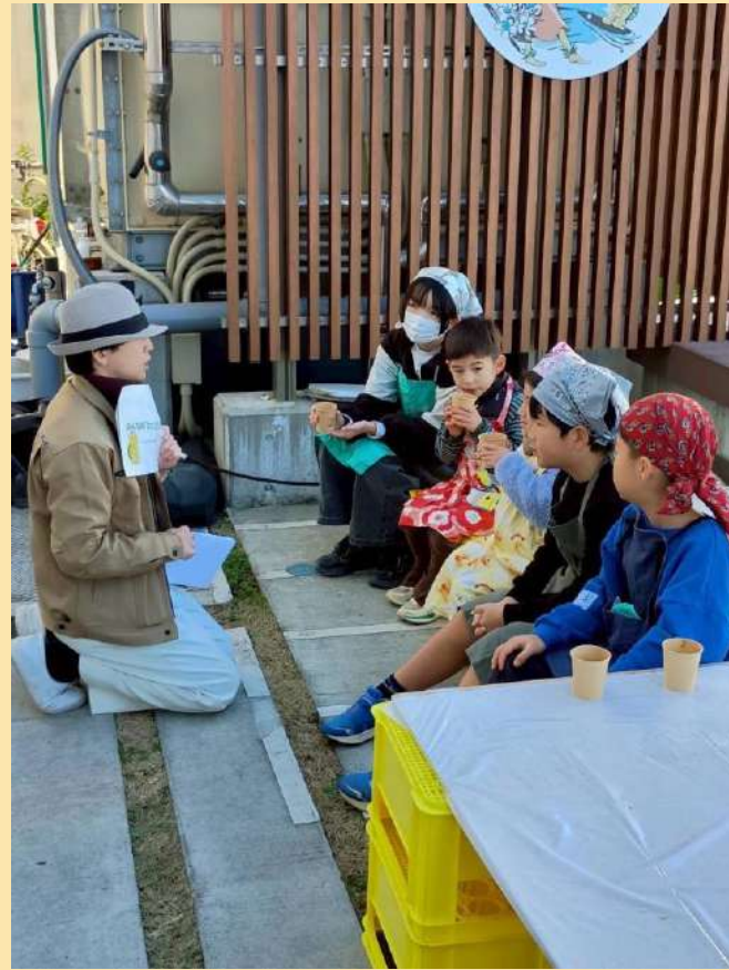
スープを飲みながらローカル ファーストの説明を聞く子供たち