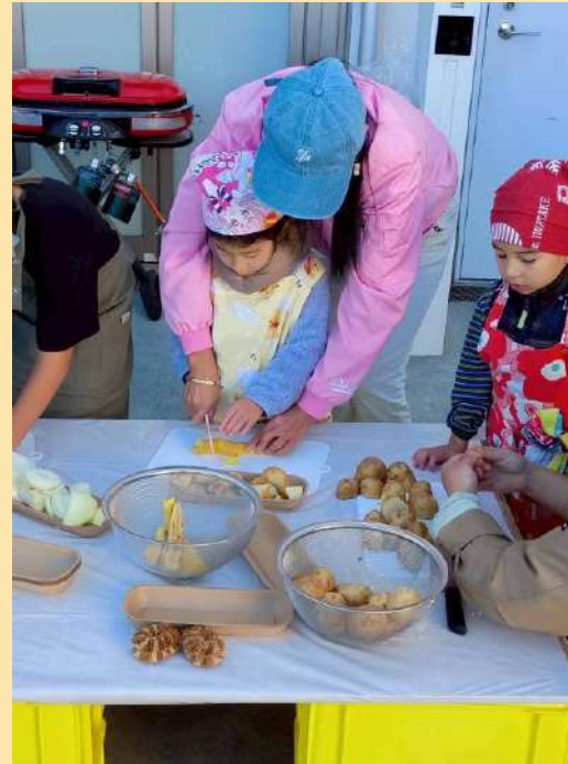
協力し合って野菜を切る子供たち